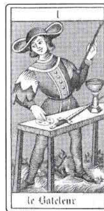
TAROTUL LUI OSWALD WIRTH